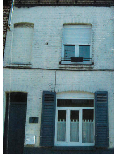
La façade de cette maison rue Joséphine s'est transformée après un ravalement de façade. Les propriétaires ont bénéficié d'une aide de la Ville.

Pour les immeubles collectifs de plus de 7 logements (grand immeuble), le montant de la subvention est calculé en fonction du nombre de logements