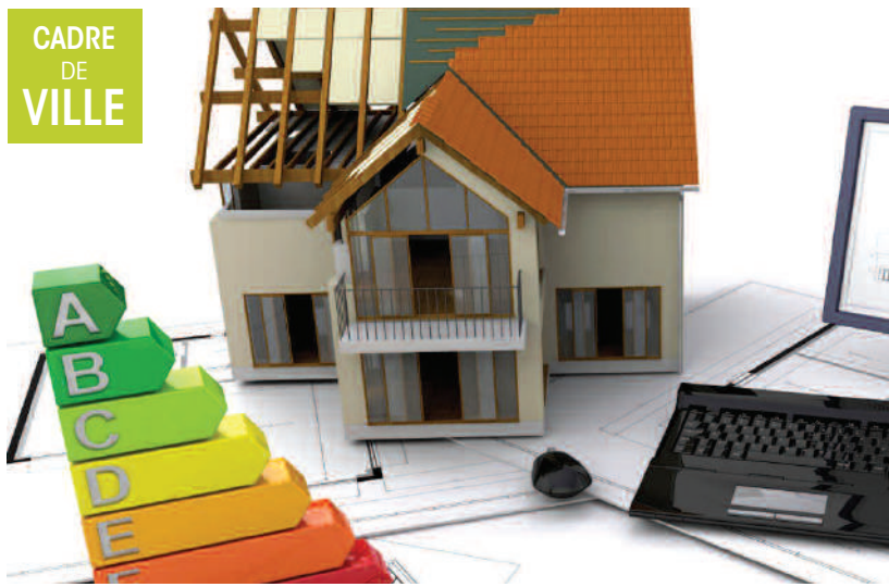
Profitez des conseils pour rénover et réaliser des économies d'énergie.

Si vous avez des projets de rénovation, faites le choix d'un accompagnement technique et financier. Vous avez besoin de conseils pour construire, rénover, se chauffer, installer des énergies renouvelables, rafraîchir, et faire des économies d'énergie au quotidien ?