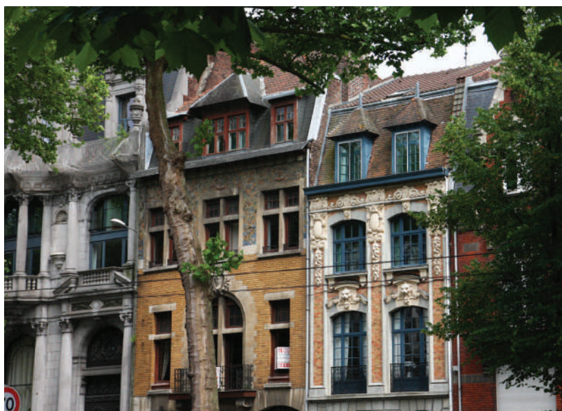
La partie madeleinoise du Grand Boulevard présente des immeubles et des maisons aux éléments architecturaux remarquables. La maison située à droite est inscrite à l'inventaire du Patrimoine Architectural.

2020 : la Chaufferie accueille la maison POC consacrée à la "Ville Collaborative" dans le cadre de la "Capitale Mondiale du Design".