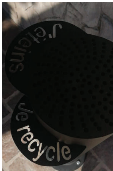
Le cendrier urbain a été réalisé par Solifactory et l'atelier EMI situés rue Roger Salengro.

Chaque année en France, 40 milliards de mégots sont jetés et un mégot met 12 ans à se dégrader dans la nature !